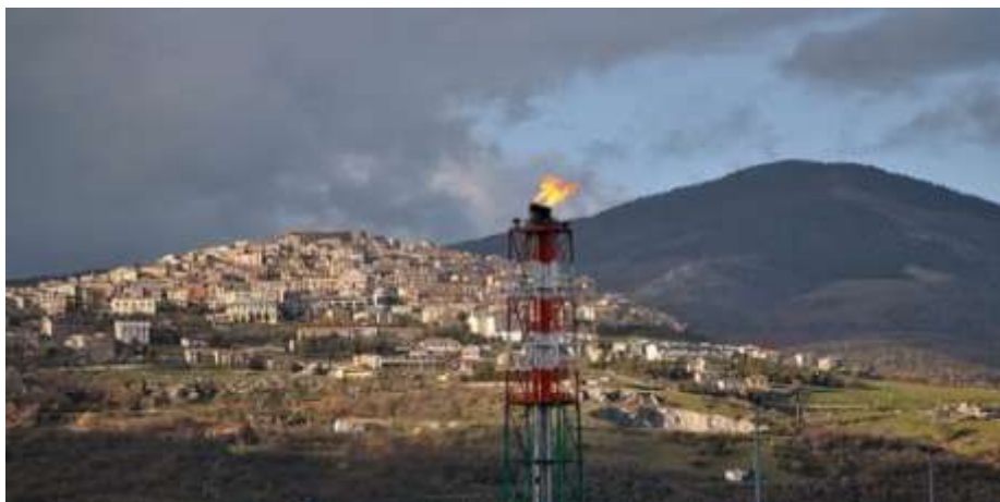
Φωτογραφία από τις εξορύξεις στην Basilicata της Ιταλίας