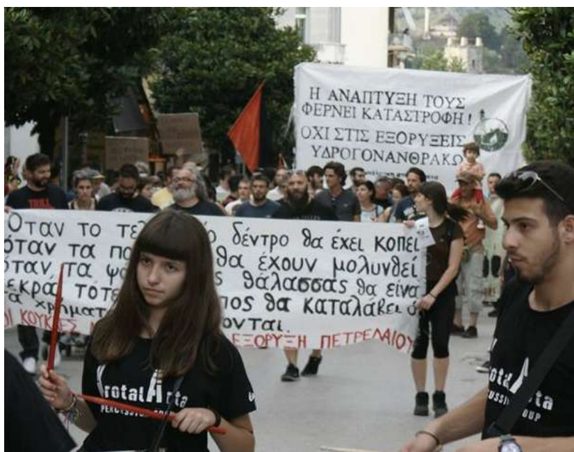
Από την μεγάλη πορεία ενάντια στις εξορύξεις της 1 ης Ιούνη 2018 στα Γιάννενα.