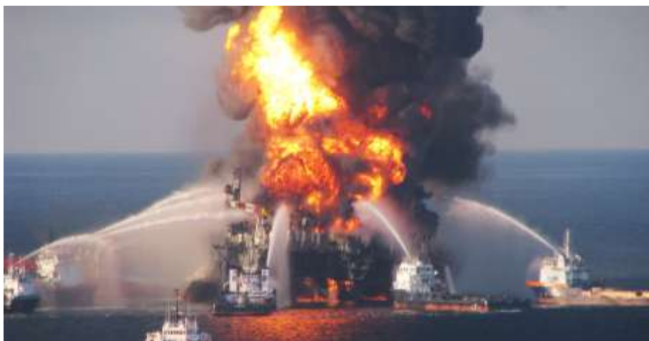
Από το ατύχημα της Deepwater Horizon της BP στον Κόλπο του Μεξικού (στο οποίο 11 άτομα είχαν χάσει τη ζωή τους) ενώ υπήρξε διαρροή σχεδόν 5 εκατ. βαρελιών πετρελαίου. (2010)